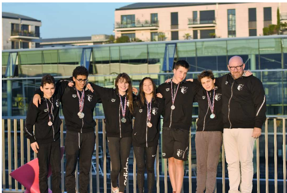
L'équipe ELITE à CAEN lors du Meeting d'HEROUILLE en Octobre 2018