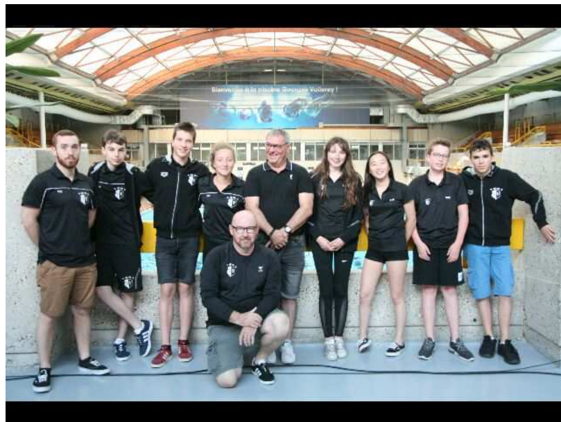
L'équipe ELITE à PARIS lors du Meeting du Neptune club en Mai 2019 à la piscine olympique Georges VALLÉREY